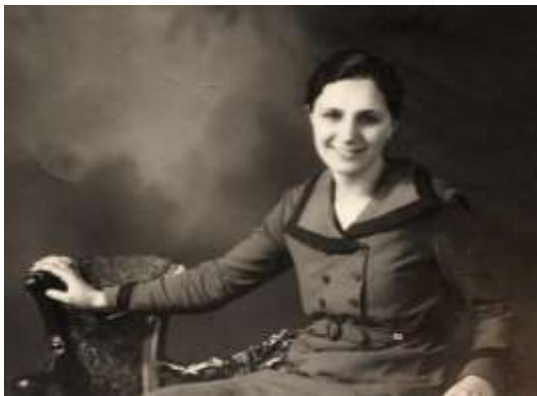
豊原高等女学校に学んだポーランド女性