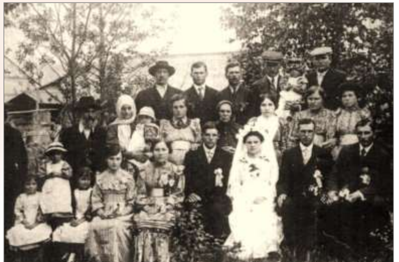
樺太時代のポーランド人の結婚式