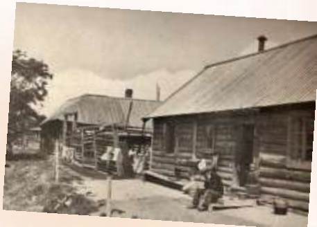
小沼のチェハンスキ家のログハウス