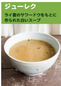
ジューレク ライ麦のサワードウをもとに作られた白いスープ

北海道大学ポーランド人留学生会 協賛:ポーランド広報文化センター 後援:北海道ポーランド文化協会