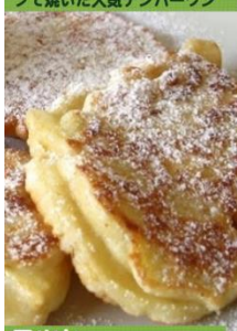
ラツヒ シャキシャキりんごが入ったパンケーキ