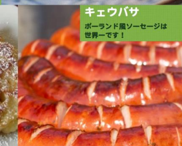
キェウバサ ポーランド風ソーセージは世界一です!