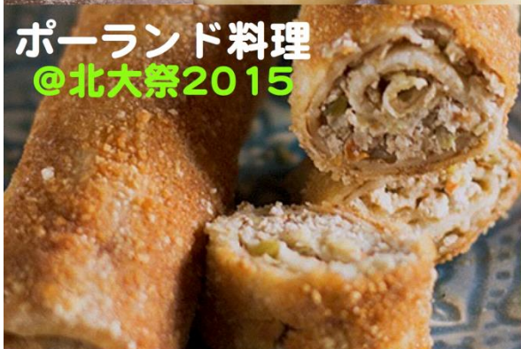
ポーランド料理 @北大祭2015