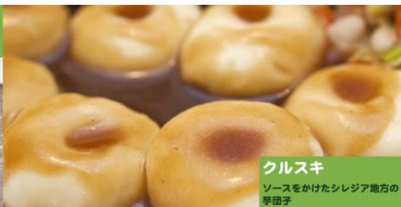
クルスキ ソースをかけたシレジア地方の芋団子