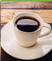
オーガニック珈琲 体にやさしいノンカフェインの穀物コーヒー「INKA」