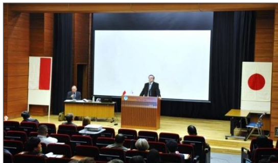
写真 2a 記念セミナー会場風景