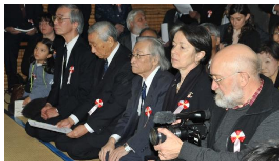
写真 3 銅像建立式典の安全祈願「カムイノミ」を取材するチェホフスキ監督(前列一番手前)。その映像はこちらから ↓ ご覧になれます。YouTube 《 polski pomnik na Hokkaido 》 http://www.youtube.com/watch?v=apYUmJl2EfU&feature=youtu.be