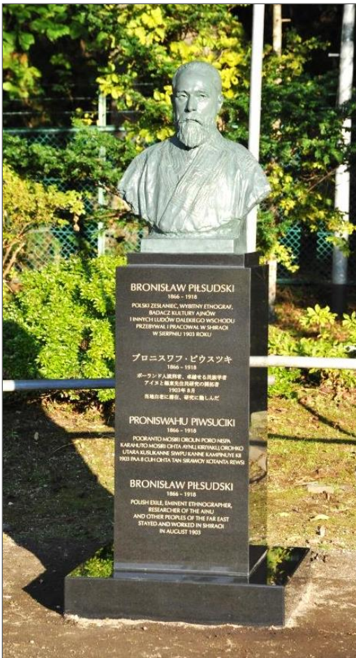
写真 1b ポーランド政府から白老町「アイヌ民族博物館」に寄贈された胸像。台座にはポーランド語、日本語、アイヌ語、英語で次の銘が刻まれている。

「蠟管」プロジェクトの終幕として、1985年9月には「ピウスツキ古蠟管とアイヌ文化」と銘打つ国際シンポジウムが、今回の記念セミナーと同じ北大学術交流会館に内外の研究者148名を結集して開催されました。同シンポジウムは、アイヌ文化を謳った大型国際集会としては世界初の試みでした。ピウスツキにかかわる国際集会はその後も継承され、1991年の第2回は「ソ連」のユジノ・サハリンスク、1999年の第3回はポーランドの古都クラクフ、ザコパネと、ピウスツキゆかりの町を巡回しました。爾来15年が経過し、近