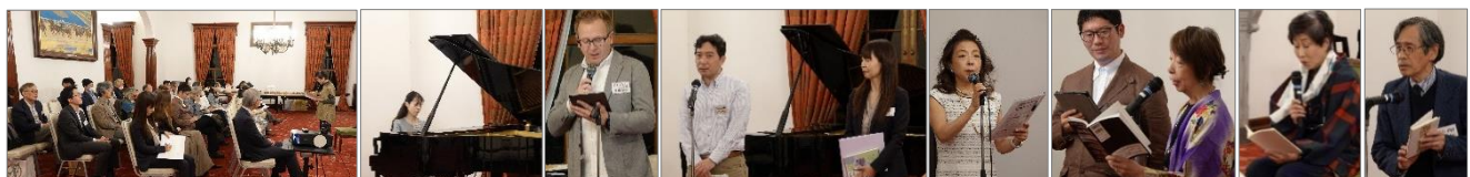
=写真= 昨年の「午後のポエジア」の情景

入場無料、定員 60 席、予約推奨【お問合せ/申込み先】080-4071-0956 (安藤) hokkaidopolandca@gmail.com